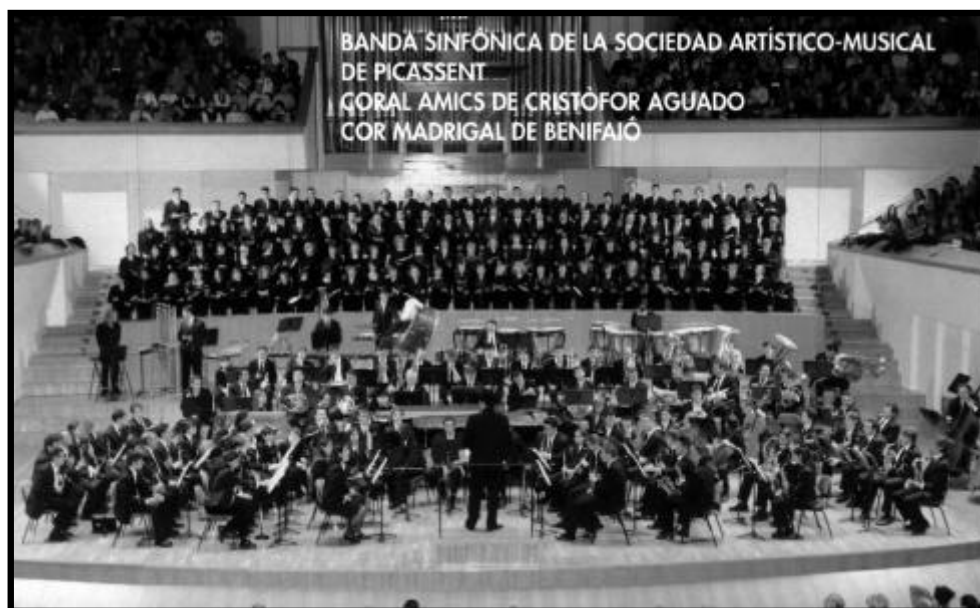
Banda Simfònica de Picassent, Coral "Amics de C. Aguado", i Cor Madrigal de Benifaíó, dirigits per Andrés

"El títol es pot considerar com un jeroglífic, ja que d'alguna manera representa la macroforma, dividida en 5 seccions. La major part dels elements que van a entrar en joc estan emparentats amb el so RE; com tònica modal, com dominant tonal, i inclús com a eix d'un cluster cromàtic de cinc sons que a més és desplegat horitzontalment en les seues 120 possibilitats. La temàtica oscil·la entre la mínima cèl·lula de dos sons, i els dos motius principals, destacant el tractament contrapuntístic del primer d'ells, i el lirisme del segon. Ja des de la introducció observem també la cohabitació de dos forces oposades, una de caràcter sinusoide i una altra incontestable, monolítica. Finalment queda ressaltar el paper protagonista que té assignada la percussió".