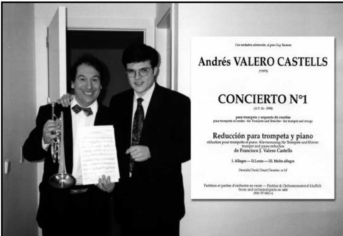
Guy Touvron i Andrés. Portada del "Concert núm. 1" AV16

de Guy Touvron, la potent editorial suïssa BIM & The Brass Press (especialitzada en partitures per a instruments