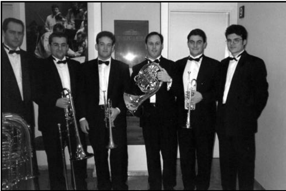
Quintet Iberbrass, Andrés

pel diàleg vivaç que es produïx entre cada secció de la corda i la trompeta solista, adquirint una densa textura contrapuntística de difícil conjunció.