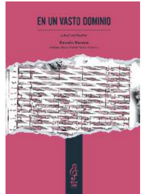
Portada de la edición crítica de En un vasto dominio .

Recuerdo que en una ocasión iba yo a asistir a un concierto del Festival Internacional de Música Contemporánea de Alicante, y le dije que si quería venir, pasaba por Alginet con mi coche e íbamos juntos. A partir de ese momento asistí en su compañía a bastantes conciertos, siendo un verdadero lujo compartir esos momentos