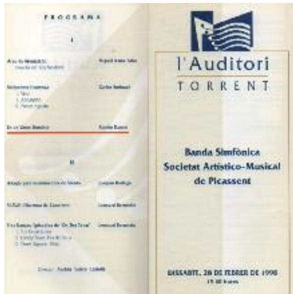
Programa del concierto en Torrent con la interpretación de En un vasto dominio .