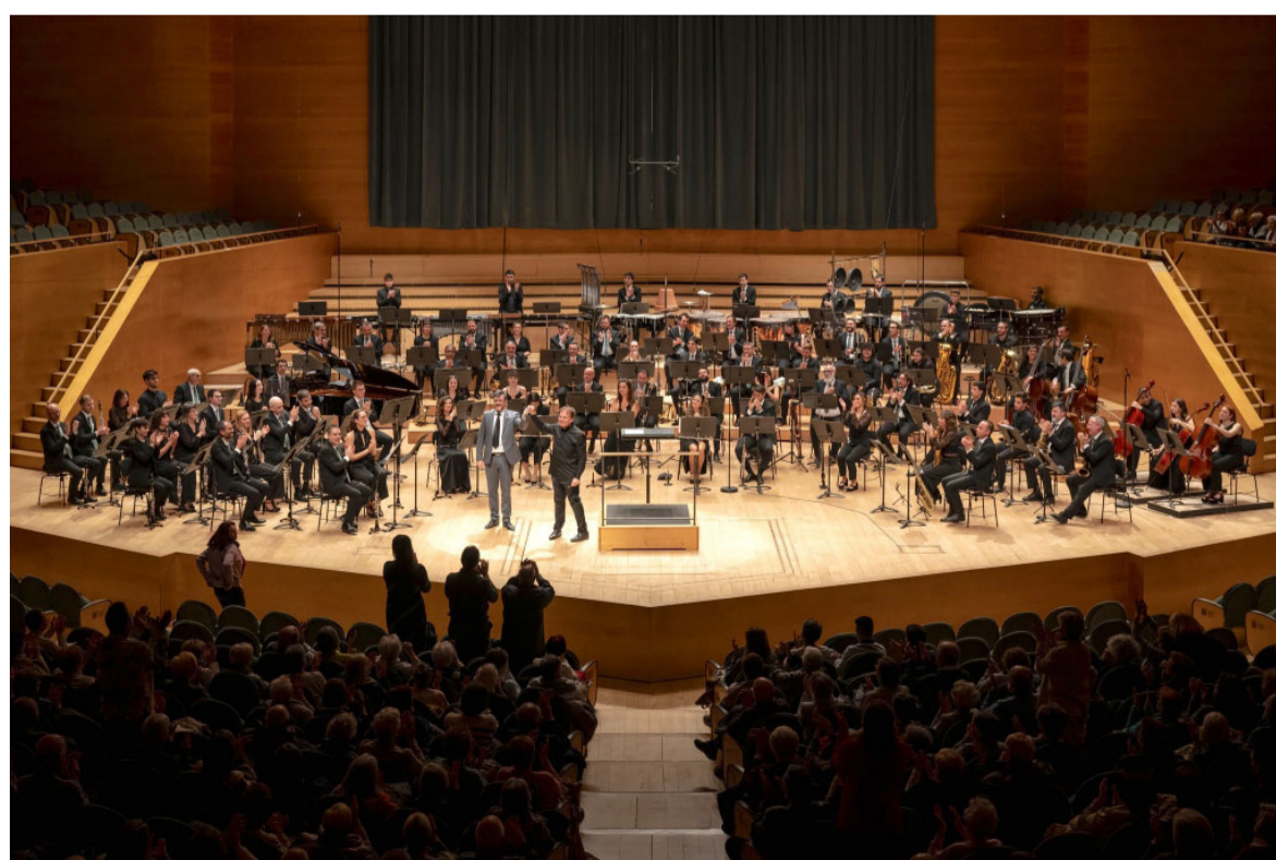
First performance in Barcelona (12 February 2023)