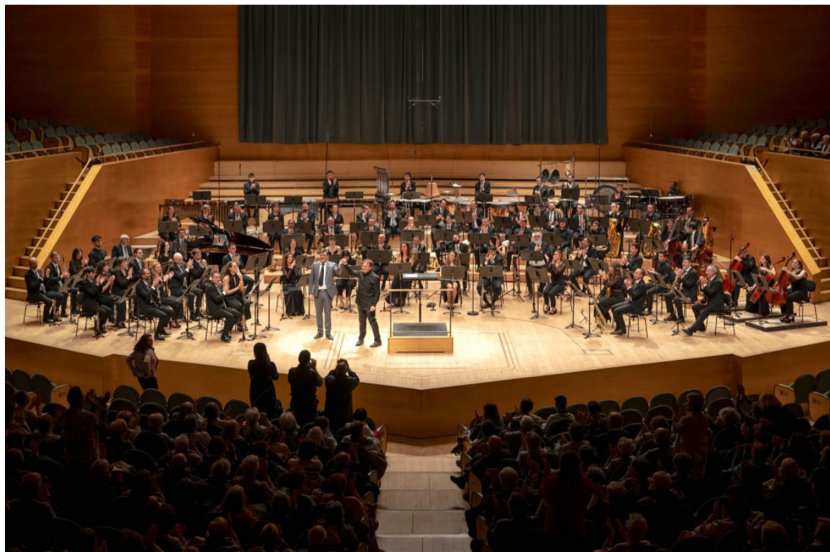
Estreno en Barcelona (12 de febrero de 2023)