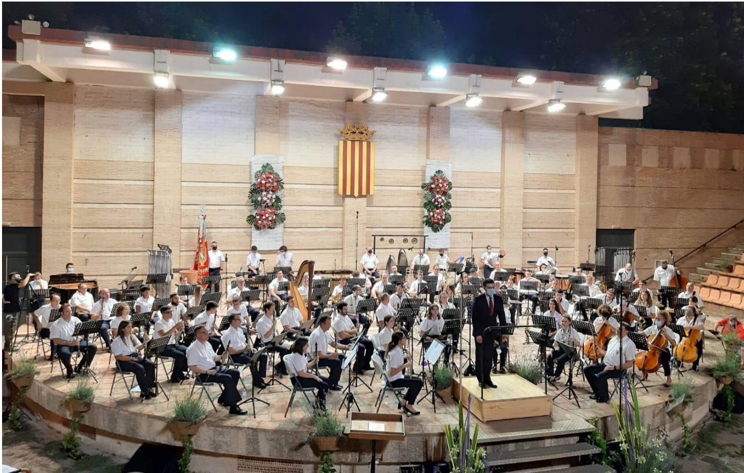
First performance in Buñol (14 August 2021)